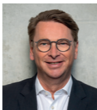
Matthias Trunk, Vorsitzender des BDEW Lenkungs-kreises Vertrieb, Vorstand GASAG AG

Die Energiewirtschaft befindet sich in einem umfassenden Transformationsprozess, in dem der Energievertrieb als Schnittstelle zum Kunden eine Schlüsselrolle einnimmt. Der Vertrieb bringt innovative und nachhaltige Lösungen zu den Kunden und ermöglicht es, die Energievertröbe auf breiter Ebene greifbar und zugänglich zu machen. Mit diesem Thesenpapier möchten der BDEW-Lenkungskreis Vertrieb und Accenture wichtige Impulse für die strategische Schwerpunktsetzung des Vertriebs bis 2030 geben.